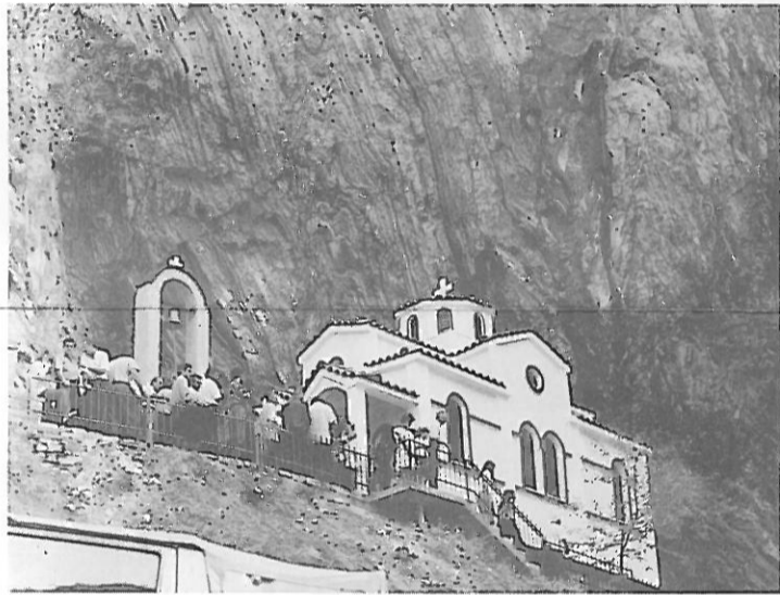
Φωτογραφία από τα εγκαίνια Ιερού Ναού Αγίου Σεραφείμ

Ανεβήκαμε στην πλατεία κι εκεί μας περίμενε πλούσιο