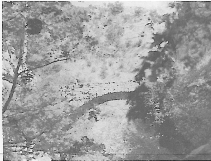
Η τοξοτή γέφυρα στα Σούϊλα

Τα χρόνια εκείνα ζούσε στο χωριό ένας άρχοντας ονόματι Κατερίνοβας. Την ημέρα του Αϊ Γιαννιού, 29 Αυγούστου, ξεκίνησε με την οικογένειά του να πάει στο πανηγύρι. Ο Ναός που γιόρταζε βρισκόταν εκεί που βρίσκεται και σήμερα στη ράχη που κατεβαίνει από τον Γαύρο μεταξύ Δάφνης και Χρύσως. Παλιός ο ναός αυτός άγνωστο πόσων ετών αφού ανακαινίσθει