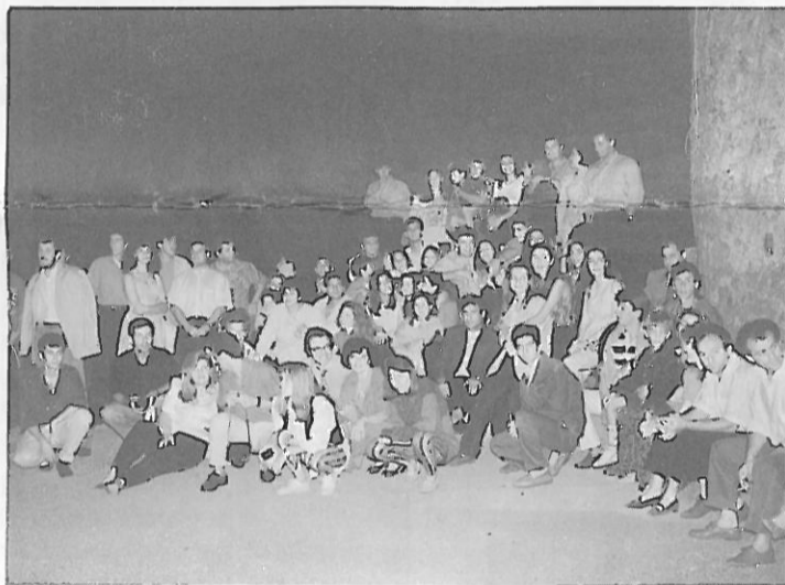
Η νεολαία του χωριού μας

Το όμορφο χωριουδάκι μας έχει αποδείξει ότι ελκύει τη νεολαία. Το καλοκαίρι άνθρωποι νεαρής ηλικίας επιδιώκουν να περάσουν έστω και λίγες μέρες στη Χρύσω. Είτε πρόκειται να μείνουν δυο μήνες ή και δυο μέρες ένα είναι το σίγουρο. Όλοι θα φροντίσουν να είναι στο χωριό στις 16 Αυγούστου. Αυτή η μέρα είναι η τιμητική της νεολαίας. Γιατί; Πριν από 15 χρόνια τα νέα παιδιά του χωριού ξεκίνησαν το έθιμο της εκδρομής. Αυτό βέβαια δεν ήταν τυχαίο. Πήγαζε από την επιθυμία τους να συναντιούνται κάθε χρόνο στο χωριό όλοι μαζί. Παρ' όλο που εγκαταστάθηκαν σε διάφορες πόλεις της Ελλάδας ήθελαν να βρίσκουν κάθε χρόνο την ευκαιρία να ανταμώνουν στο χωριό.