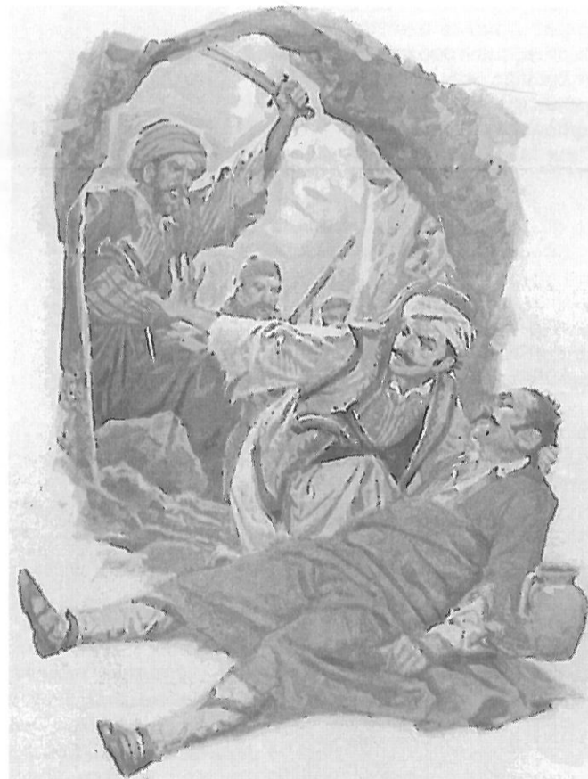
Το χαράτσι και το χωριό Άγραφα