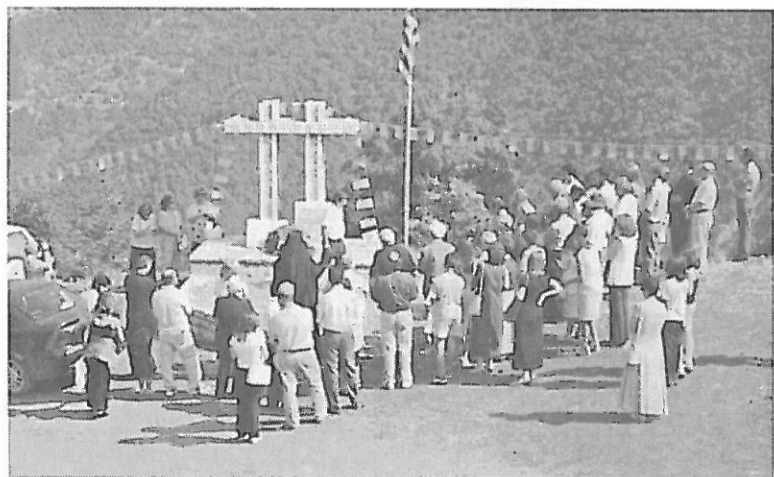
Στιγμιότυπο απ' την κατάθεση στεφάνων στη θέση "Νιμάτι" όπου εκτελέστηκαν οι 7 αγωνιστές της Εθνικής Αντίστασης από τους Ιταλούς κατακτητές.