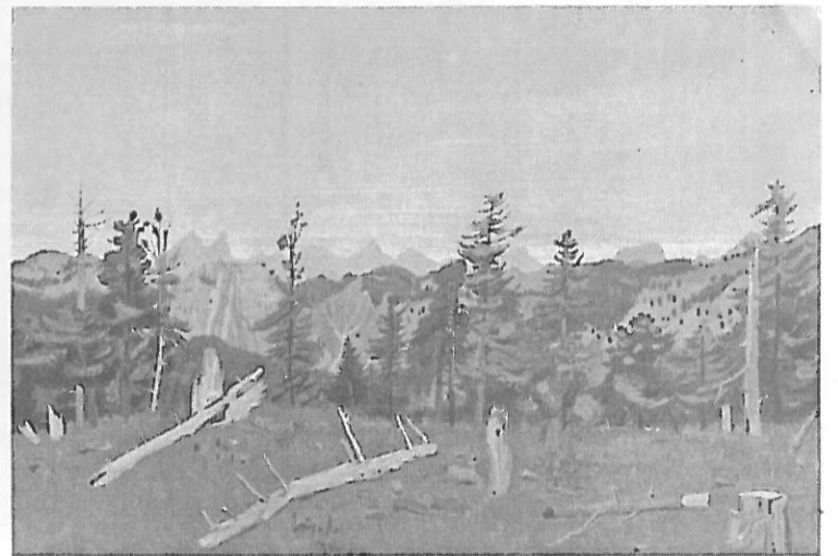
Τα βουνά των Αγράφων. Πίνακας ζωγραφικής του Σπύρου Βασιλείου

Αυτούς τους κώδικες επικοινωνίας ανθρώπου και φύσης περιγράφει εξαιρετικά το κείμενο που ακολουθεί. Γράφτηκε το 1906 από τον Ι. Π. Σταματούλη, Ξυλόκαστρο και δημοσιεύτηκε στην εφημερίδα Α.Ο.Δ.Ο. της 8/1/1906.