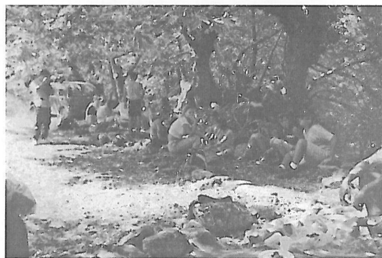
Στιγμιότυπο από τη φετινή εκδρομή στο Ρέμα την 16η Αυγούστου