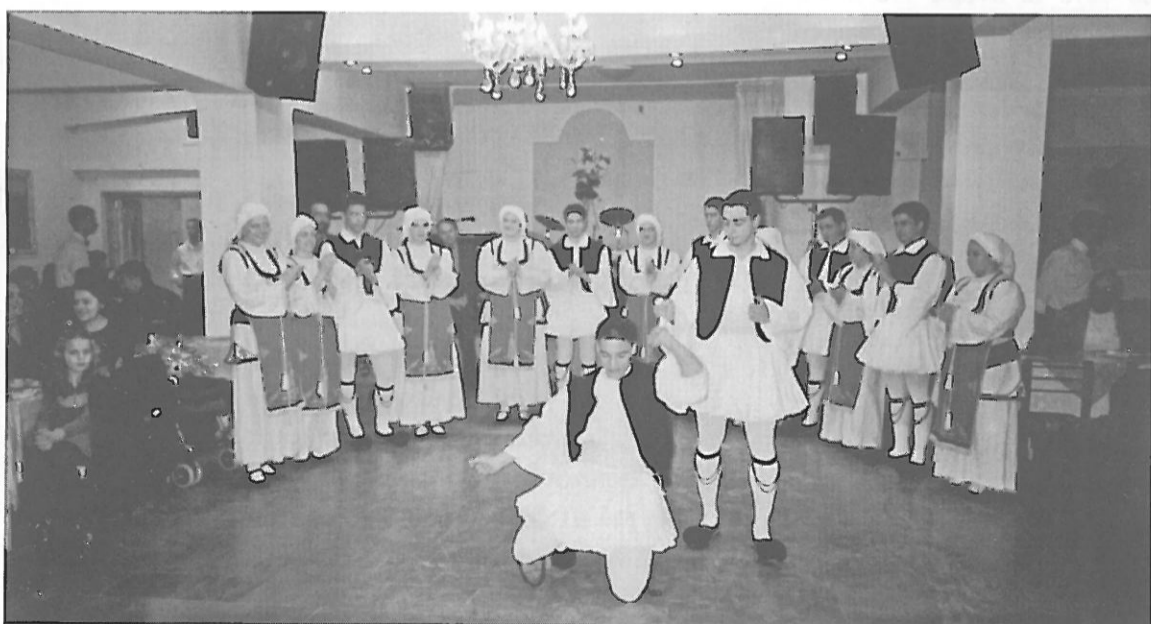
Από τη χοροεσπερίδα στη Λαμία. Το χορευτικό του Συνδέσμου Ευρυτάνων Φθιώτιδας παρουσιάζοντας παραδοσιακούς χορούς.

Πραγματοποιήθηκαν και φέτος με μεγάλη επιτυχία οι χοροί του συλλόγου μας σε Λαμία και Αθήνα, γεγονός που επιβεβαιώνει το αμείωτο ενδιαφέρον των χωριανών μας για τον τόπο τους και επικροτεί τις δραστηριότητες του Δ. Σ. του Συλλόγου μας. Πρώτα έγινε ο χορός στη Λαμία το Σάβ- Συνέχεια στη σελ. 4