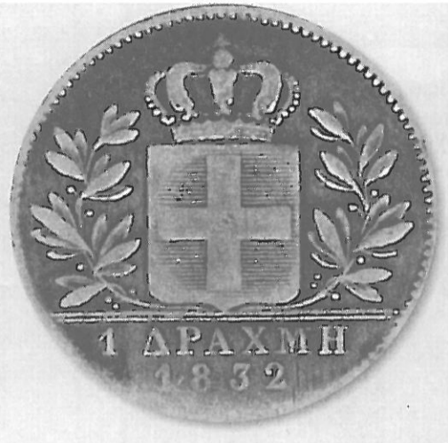
Η πρώτη δραχμή του νεοσύστατου ελληνικού κράτους η οποία κόπηκε στο Μόναχο το 1832

Πτολεμαίου Α' Σωτήρα - Πτολεμαίου Α' Αιγύπτου - Περσέα Μακεδονίας, το χρυσό 10δραχμο της Βερνίκης β' και το χρυσό 8δραχμο της Αρσινόης Β'.