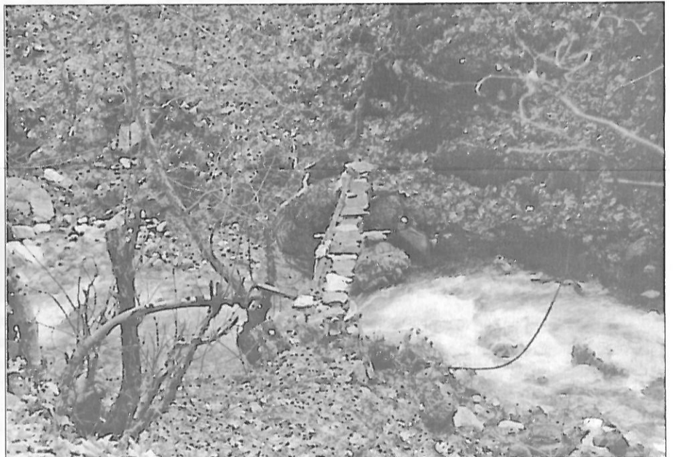
Πρόχειρο γεφυράκι με "τέμπλες" και πλάκα στρωμένη στον ποταμό Χρυσιώτη, για να περνούν τα γιδοπρόβατα και οι τσοπάνηδες.