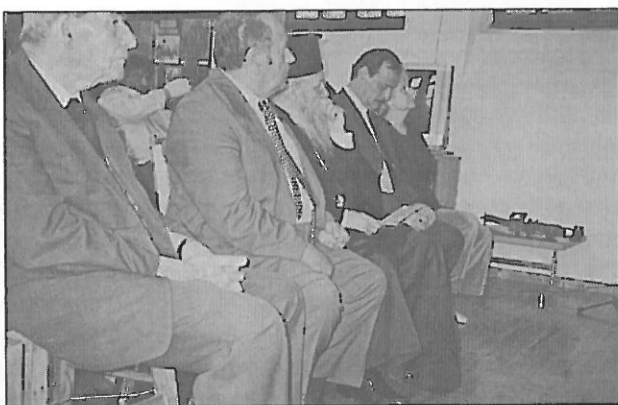
Θ. Καλλίνος, Βασ. Τσίπρας (Βουλευτής Ευρυτανίας), κ. κ. Νικόλαος (Σεβασ. Μητροπολίτης Ευρυτανίας), Κ. Καράνης (Δήμαρχος), κ. Σβώλου (ανιψιά του Αλεξ. Σβώλου)