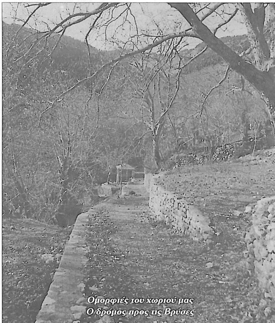
Όμορφιές του χωριού μας Ο δρόμος προς τις Βρύσες