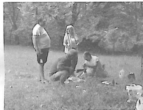
Το κοντοσούβλι ετοιμάζεται

Πραγματοποιήθηκε και φέτος η καθιερωμένη εκδρομή της νεολαίας, στις 16 Αυγούστου στη λογιά του Τσάτσου. Η συμμετοχή δεν ήταν μεγάλη αλλά το έθιμο κράτησε για μια ακόμη χρονιά.