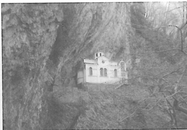
θα σας συναρπάσει το εξωκλήσι χωμένο κυριολεκτικά στον βράχο

Γεύσεις Σε κάθε περίπτωση συνιστούμε να έχετε κάτι πρόχειρο μαζί σας, καθώς όταν κινείστε στα Άγραφα δεν υπάρχει τίποτα που να μπορείτε να θεωρήσετε δεδομένο. Λίγα καφενεία θα σας υποδεχθούν, όπου είναι βέβαιο