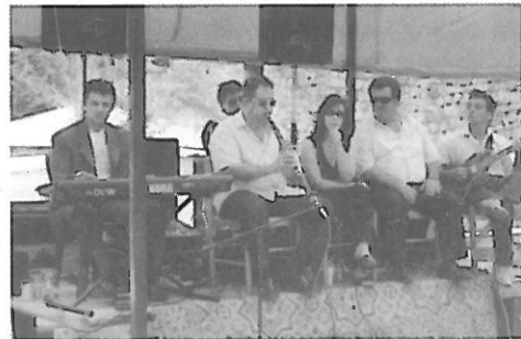
Η ορχήστρα του 15Αύγουστου σε ώρα «χαλαρού» παίξιματος.

Πάρα πολύ κόσμο είχε φέτος στο πανηγύρι. Η διαπίστωση αυτή δεν είναι μόνο δική μου αλλά κοινή ομολογία. Τα τρία μαγαζιά δουλέψαν πολύ καλά, ανταποκρίθηκαν επαρκώς στις απαιτήσεις του κόσμου και πρέπει να είχαν ικανοποιητικά έσοδα. Εδώ θα πρέπει να επισημάνω