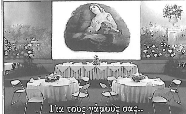
Για τους γάμους σας..

ΑΓ. ΓΛΥΚΕΡΙΑΣ 44 (ΟΠΙΣΘΕΝ ΚΤΙΡΙΟΥ) Είσοδος: ΖΗΝΩΝΟΣ 5, 111 46, Γαλάτσι τηλ.: 210 2131356 - 6972 405911