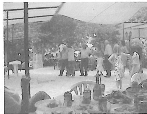
Χρυσιώτες χορεύοντας παραδοσιακούς χορούς

και το γεγονός ότι για μια ακόμη χρονιά μας τίμησαν με την παρουσία τους στο πανηγύρι σχεδόν όλοι οι φίλοι από τον Άγιο Δημήτριο και Δάφνη. Τους αξίζει ένα μεγάλο ευχαριστώ από όλους τους Χρυσιώτες και πρέπει, όσο μπορούμε, να τους το ανταποδίδουμε με την παρουσία μας στα δικά τους πανηγύρια. Η φετινή τους παρουσία, όπως και κάθε χρόνο άλλωστε, δείχνει ότι δεν ξεχνούν την κοινή μας καταγωγή, την πανέμορφη Χρύσω.