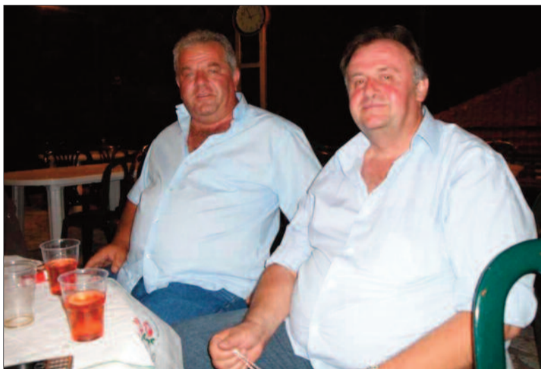
ΦΩΤΟ 3: Το κόκκινο χρώμα στα πρόσωπά τους δεν είναι από ντροπή, αλλά ίσως απ' το κρασί! Η όλη τους εμφάνιση μαρτυρά ότι είναι ένοχοι!