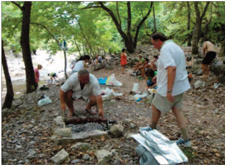
ΦΩΤΟ 1: Ο ένας εκ των δύο ληστών σκύβει ταχύτατα με μεγάλη ευελιξία και αρπάζει το ψημένο κοντοσουύβλι!

Κανείς βέβαια δεν τους πίστεψε πως μετανόησαν, γιατί όπως φαίνεται και στη 3η φωτογραφία, η οποία τραβήχτηκε αμέσως μετά το συμβάν, πέρα από το χαμόγελο ικανοποίησης, παρά την απεχθή τους πράξη και τις έτοιμες να εκραγούν κοιλιές τους, συνοδεύουν προκλητικά και με απόλαυση τα κλοπιμαία τους με κρασί και μάλιστα κόκκινο!