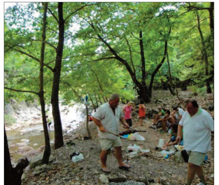
ΦΩΤΟ 2: Επειδή το κοντοσουύβλι καίει, το συγκρατεί με ξύλα και απομακρύνονται βιαστικά!