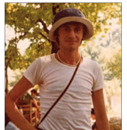
Στις δύο αυτές φωτογραφίες, είναι οι δράστες, ναι!, σίγουρα πριν φάνε το κοντοσουύβλι!