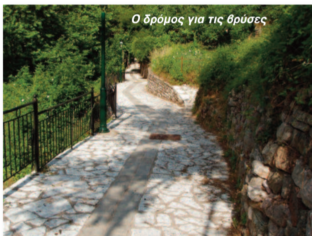
Ο δρόμος για τις θρύσες

✓ Έγινε κοπή χόρτων και καθαρισμός όλων των κεντρικών δρόμων, αλλά και στα σοκάκια του χωριού, στο νεκροταφείο, καθώς βεβαίως και στους δρόμους που οδηγούν στα αξιοθέατα του χωριού όπως στις Βρύσες, στο νερόμυλο και στην Παναγία. Καθαρίστηκε επίσης και ο χώρος κάτω απ' τις Σκεπαστές Βρύσες και όλο το मुλαύλακο μέχρι τη Γκούρα. Είχαν πέσει μέσα στο χειμώνα και αρκετά μεγάλα κλαδιά από τα πυκνά δέντρα της περιοχής.