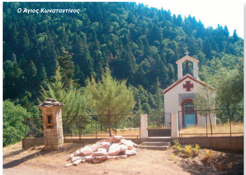
Ο Άγιος Κωνσταντίνος