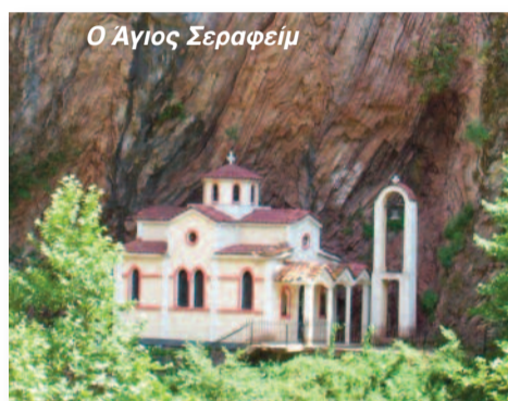
Ο Άγιος Σεραφείμ

Είναι ο πολιούχος του χωριού μας. Ο Άγιος Σεραφείμ γεννήθηκε στην Πεζούλα Καρδίτσας, μόνασε στη μονή Κορώνης Καρδίτσας κι αργότερα έγινε επίσκοπος Φαναρίου και Νεοχωρίου Καρδίτσας. Κατά την επανάσταση του Σκυλόσοφου το 1601 θανατώθηκε μαρτυρικά από τους Τούρκους.