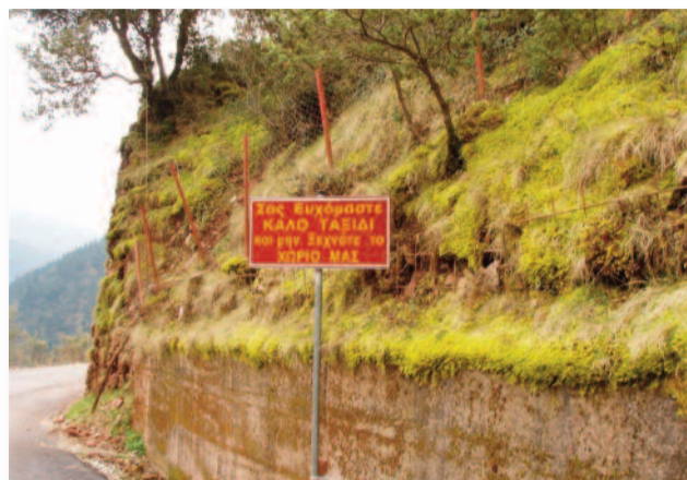
Πινακίδες στην είσοδο του χωριού

✓ Έγινε μερική αποκλάδωση των δέντρων πάνω και κάτω απ' τον περίπατο προς Αϊ Γιώργη και προς την Παναγία.