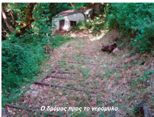
Ο δρόμος προς το νερόμυλο

✓ Καθαρίστηκε ο χώρος του οικοπέδου Σαρρή, λίγο πριν την είσοδο στην πλατεία κι έτσι αυξάνονται και οι διαθέσιμες θέσεις στάθμευσης.