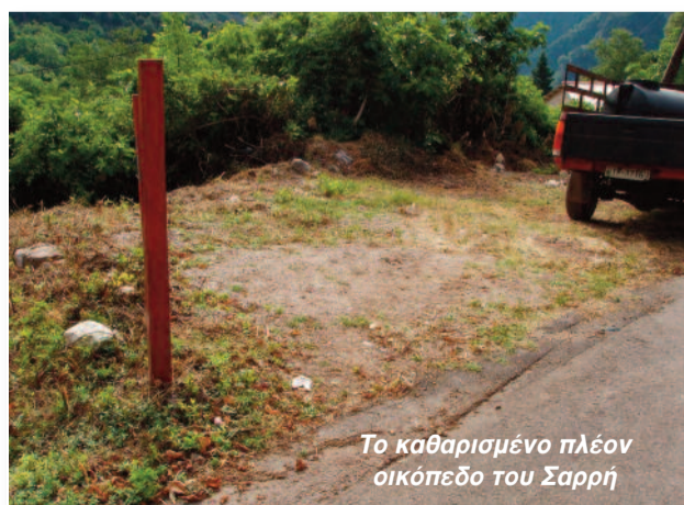
Το καθαρισμένο πλέον οικόπεδο του Σαρρή

✓ Καθαρίστηκε ο χώρος του οικοπέδου Σαρρή, λίγο πριν την είσοδο στην πλατεία κι έτσι αυξάνονται και οι διαθέσιμες θέσεις στάθμευσης.