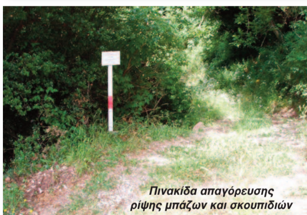
Πινακίδα απαγόρευσης ρίψης μπαζών και σκουπιδιών

✓ Καθαρίστηκαν οι οχετοί του κεντρικού δρόμου προς το χωριό που είχαν κλείσει απ' τις τελευταίες δυνατές βροχές.