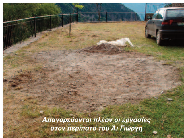
Απαγορεύονται πλέον οι εργασίες στον περίπατο του Αϊ Γιώργη