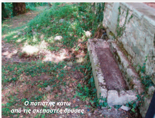
Ο ποτιστής κάτω από τις σκεπαστές θρύσες