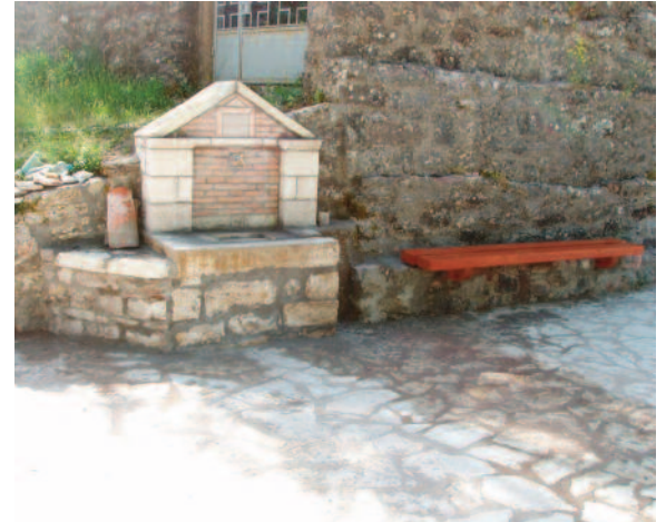
Η βρύση σήμερα